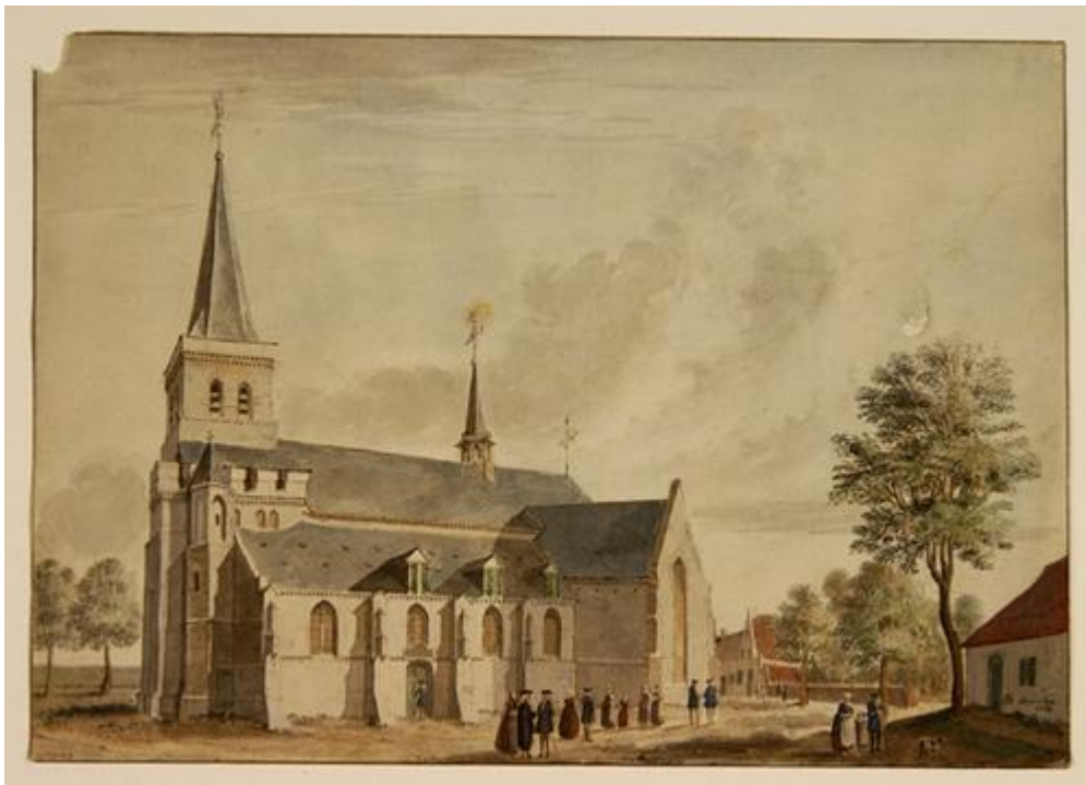
Figuur 1 Originele prent van Jan de Beijer, met op de achtergrond café D'n Engel?

Het pand Koningsplein 16 ("Anneke de Bruijn") staat midden in het dorp. Om de geschiedenis van die plek te begrijpen is het niet handig om alleen naar het pand zelf te kijken. Er is een bepaalde synergie in het dorp die soms in geschriften naar voren is gekomen, maar nooit echt naar de voorgrond is getreden. Daarom beginnen we midden op het Koningsplein. Wat nu het Koningsplein is, was in de jaren '10 van de vorige eeuw een park: het Plantsoen. In de periode ervoor was het geen plantsoen, maar stond daar de vroegere kerk van Asten. De huidige grote kerk is pas in 1898 gebouwd. Die kerk op het Koningsplein zou in de 15 e eeuw (1478) zijn gebouwd. Na de teruggave van de kerk aan de katholieken in 1798 is de kerk enkele keren vergroot. De kerk werd alsmaar te klein en op een gegeven moment ontstond het plan om een nieuwe kerk te bouwen. Bluijssens, de grote boterfabrikant in Asten, en enkele medestanders wilde de kerk waar nu het Raadhuis is. De pastoor echter wilde de kerk tegenover de oude kerk op de plek waar nu de kerk staat. Dat is uiteindelijk gelukt, maar dat had nog wel wat voeten in de aarde: de kerk is gebouwd op de pastorievijver waar eertijds kapelaan Raymakers was verdronken. Na de bouw van de huidige kerk is de oude kerk gesloopt. Eigenlijk wilde ze de stenen van de oude kerktoren hergebruiken (als klinkers), maar deze toren stortte in tijdens de sloop en waren ze niet meer te gebruiken.