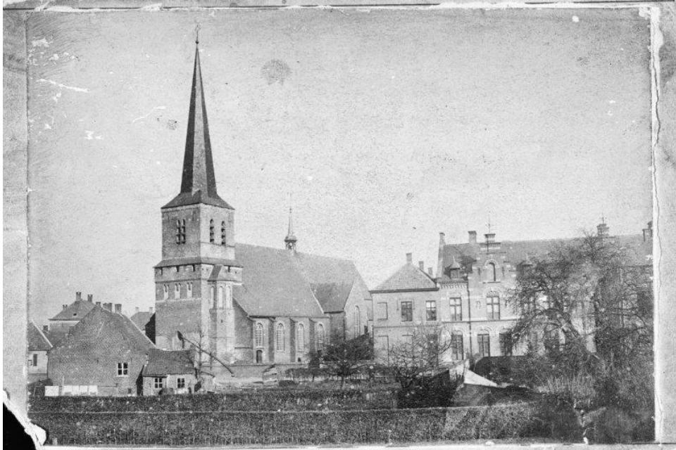
Figuur 2 de Oude kerk van Asten met zijn kantelen in het midden. Rechts het Bartholomeus en links in het hoekje Anneke de Bruijn. Het huis wat daarvoor staat is de plek waar de huidige kerk staat.

de scheiding vormen, laten ook nog eens zien dat de toren misschien wel een verdedigbare toren (of misschien zelfs een donjon) is geweest. Dat fenomeen – kantelen op een kerk – is tot nu toe nog niet in andere plaatsen in Nederland gevonden. Er staan soms nog weerkerken in Noord-Frankrijk of in Transylvanië, maar tot nu toe niet in Nederland. Die kantelen duiden erop dat de kerktoren misschien wel véél ouder is dan 1478. Het zou goed kunnen zijn dat de toren uit de dertiende eeuw komt. Dat betekent dat die toren ongeveer even oud is als de eerste vermelding van Asten. Theo Meulendijks heeft dit verhaal weer nieuw leven ingeblazen, maar het blijkt dat Piet van der Zanden dit al dacht toen de kerk in 1948 vijftig jaar werd!