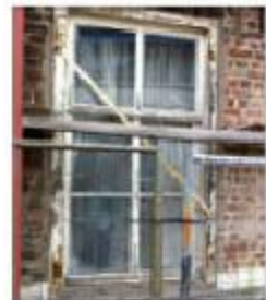
Figuur 4. 19e eeuwse raam.

er tijdens het bouwen toch niet goed uitgekomen is met de afmetingen, en de bouwers toen maar besloten hebben een liggende metsel laag te leggen. Daarnaast is er een jugendstil ingreep gepleegd met de op figuur 6 zichtbare raamstijl. Jugendstil is herkenbaar aan de organische vormen en bloemmotief. Het zijn maar een paar van de vele voorbeelden van verschillende stijlen verwerkt in het huis.