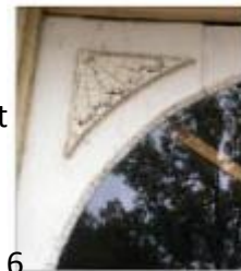
Figuur 6. Jugendstil raamstijl.

Zoals al in de deelvraag van geschiedenis is uitgelegd, heeft het pand veel verschillende eigenaren en functies gehad. Dit is ook terug te zien aan het exterieur van het pand. Je ziet bijvoorbeeld buiten kleine lichtjes en een klein deurtje. Dit kan betekenen dat een deel van het pand heeft gefunctioneerd als varkenskot. En zo is in de 18 e eeuw over de muur gepleisterd. In die tijd had Asten te maken met een economische welvaart. Onder andere door de productie van klokken, waar Asten nog steeds bekend om staat. Deze welvaart heeft zich dus geuit in deze 'verbetering'. Een toevoeging die toen in de mode was.