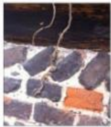
Figuur 5. De liggende vleilaag.

Zoals vele mensen beschrijven is het pand van Anneke de Bruijn een krot. Het kent vele mankementen, en is op veel plekken kapot. Er zit een scheur in het huis. Dit is veroorzaakt door zwaar verkeer uit de 20 e eeuw. Vrachtwagens die voorbij komen, lieten de muren dusdanig trillen, dat er scheuren in het metselwerken ontstonden. Ook is er veel algemene verkrotting aan het pand. Daarentegen heeft het pand van